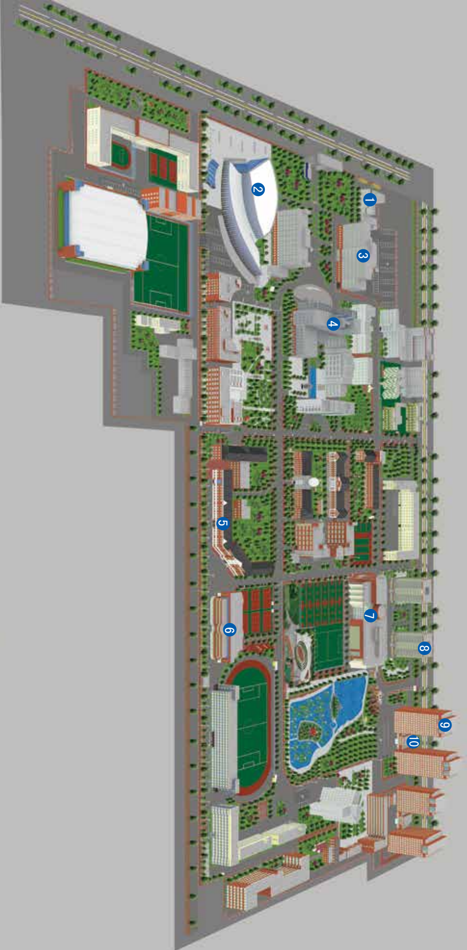
Схематическая картина для главная студенческих городка